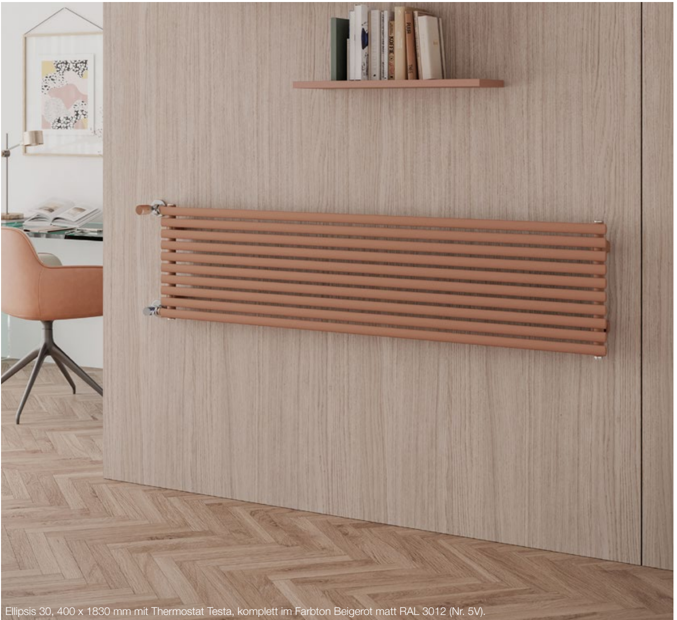
Ellipsis 30, 400 x 1830 mm mit Thermostat Testa, komplett im Farbton Beigerot matt RAL 3012 (Nr. 5V).

Ellipsis 30 - Der neue Top-Raumwärmer mit den feinen, zu Ellipsen geformten Oval-Profilrohren 30 x 15 mm. Mit seinem ästhetischen und außergewöhnlichen Design integriert sich Ellipsis 30 dezent und elegant in jeden Raum.