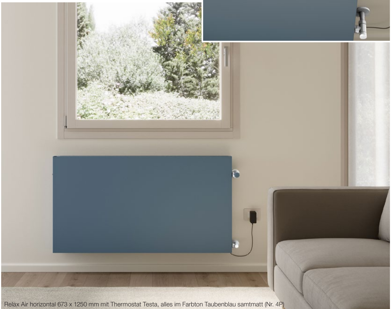
Relax Air horizontal 673 x 1250 mm mit Thermostat Testa, alles im Farbton Taubenblau samtmatt (Nr. 4P)