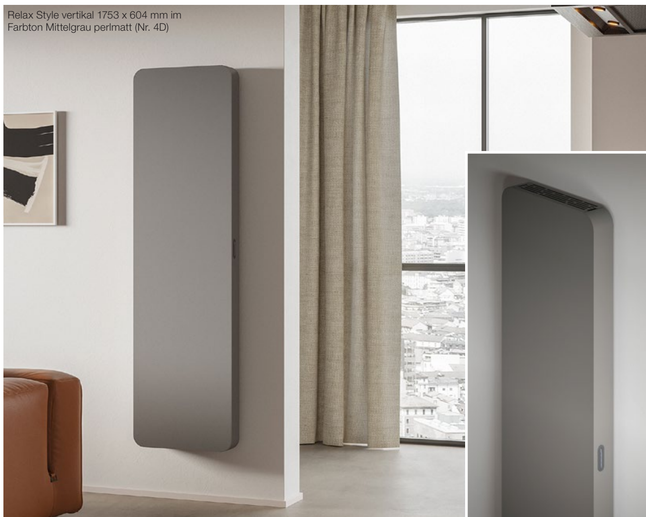
Relax Style vertikal 1753 x 604 mm im Farbton Mittelgrau perl matt (Nr. 4D)