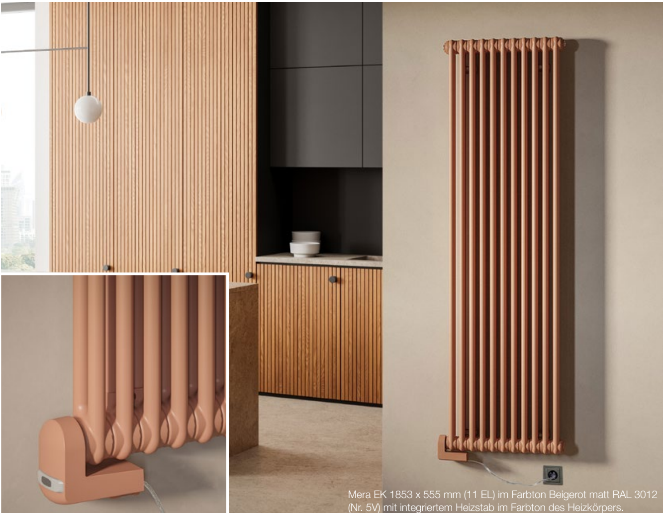
Mera EK 1853 x 555 mm (11 EL) im Farbton Beigerot matt RAL 3012 (Nr. 5V) mit integriertem Heizstab im Farbton des Heizkörpers.

Mera EK - im neuen Design! Der Elektrokomplett-Röhrenradiator ist mit einem neuen Elektroheizstab mit Reglergehäuse im Farbton des Heizkörpers verfügbar und ersetzt die bisherige Ausführung des Mera EK.