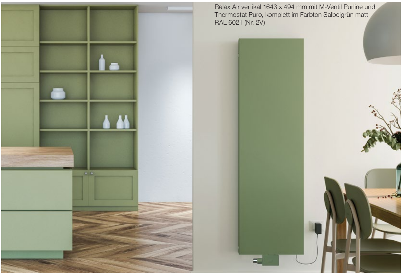
Relax Air vertikal 1643 x 494 mm mit M-Ventil Purline und Thermostat Puro, komplett im Farbton Salbeigrün matt RAL 6021 (Nr. 2V)